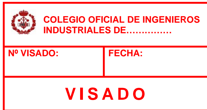
Imagen 1. Contenido mínimo del sello de visado

Proyectos de obras, de instalaciones o de actividades, certificados, estudios, informes y trabajos diversos.