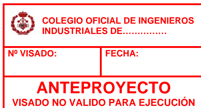
Imagen 2. Contenido mínimo del sello de visado de Anteproyecto

Como parte fundamental del Anteproyecto debe estar la organización en planta de lo proyectado y los elementos básicos que entran en su construcción, así como una estimación aproximada del coste y un planning de actividades y tiempo. El Anteproyecto debe contener, en general: Memoria descriptiva, Planos a gran escala y Presupuesto orientativo.