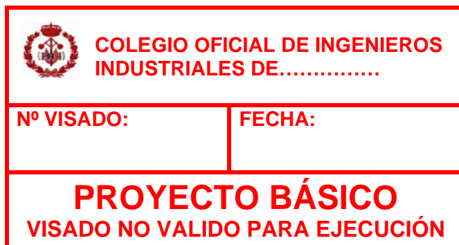
Imagen 3. Contenido mínimo del sello de visado de Proyecto Básico

ciones administrativas que al efecto sean exigibles para la concesión de la licencia o autorización correspondiente. Todo Proyecto Básico debe contener, en general: Memoria, Planos y Presupuesto.